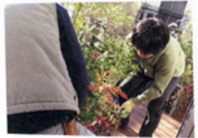
3つ運び入れてもらう。