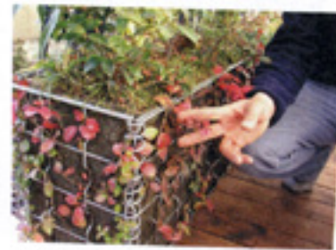
伸びたら切ってもいいし、巻きつけてもいいんですって。