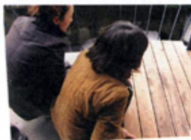
やっ、できたのですね。 分割されているんですね。