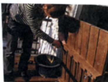
どういふふうに？ 足になっている金具のねじで高さを調整。