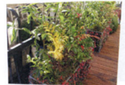
3つも並べるとうとうしい。