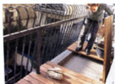
カタカタ鳴る場所はもう一度調整。