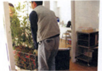
とても重いらしい。大人の男性が2人がかりでも大変そう。