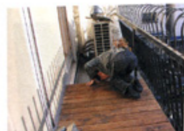
下のコンクリートに足はついているかな？