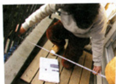
この方は男性です。無口でさっさと仕事をして。