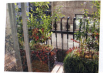
なんかきゅうくつそうです。