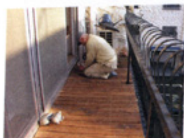
細いすまがコーティングしてなかったらしい。 そこを筆で塗っているところ。