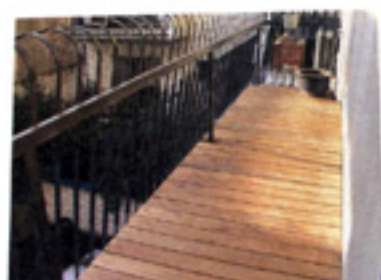
はい、できあがり。完成です！ いいんじゃない、このまんまでという声もあり。