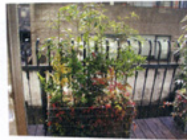
それでひとつキャンセル。今回はいちおう特別にそうしていただいた。