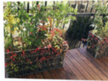
やっぱり空間がなくなっちゃ。これくらいは間をとりたい。