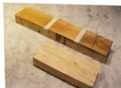
杉板に色をつけた見本から選びます。 色はコーティングにもなっている。