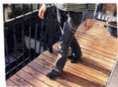
歩いてみて、様子を見て。