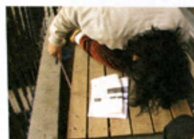
きちんとあちこち計って。メモして。 でもあれで大丈夫なのかなとちょっと心配。