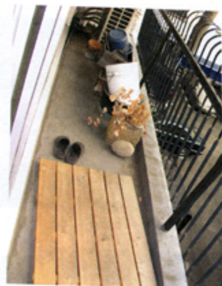
こんなに汚いベランダでした。 お恥づかしいです。